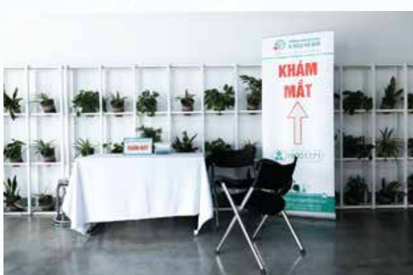
Công cụ, dụng cụ khám mắt