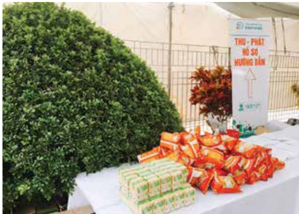
Suất ăn nhẹ sau lấy máu