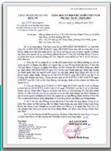
Giấy đủ điều kiện khám sức khỏe và khám sức khỏe lái xe