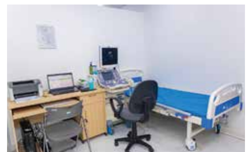
Phòng siêu âm