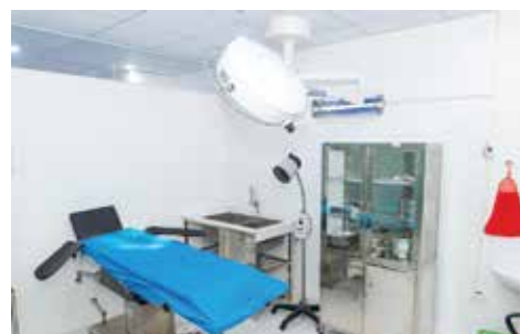
Phòng tiểu phẫu