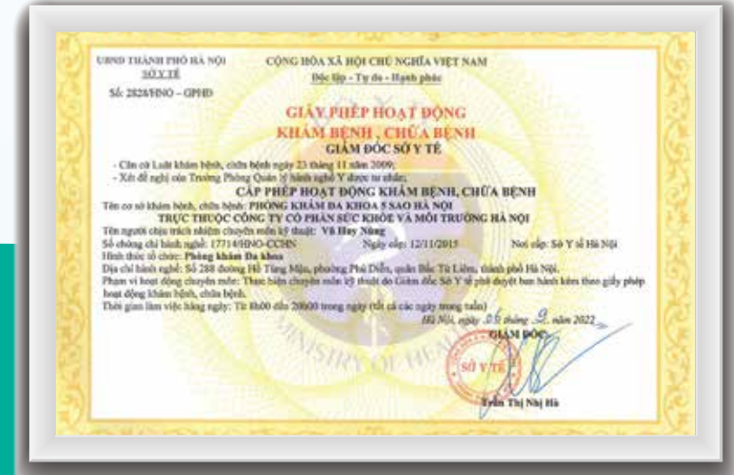
Giấy phép hoạt động khám bệnh, chữa bệnh