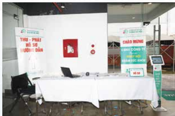
Khu vực thu phát hồ sơ lưu động