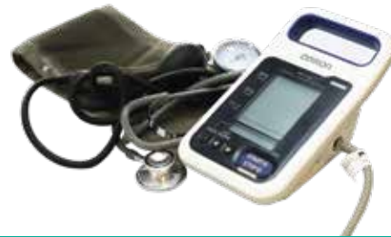
Hệ thống đo huyết áp điện tử