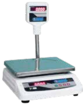
Hệ thống cân đo điện tử