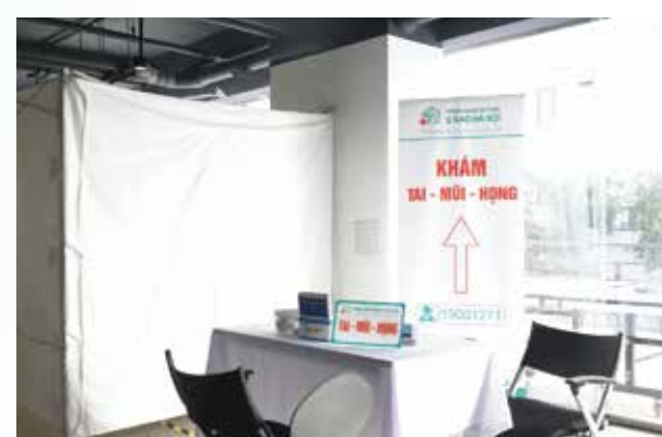
Công cụ, dụng cụ khám tai mũi họng