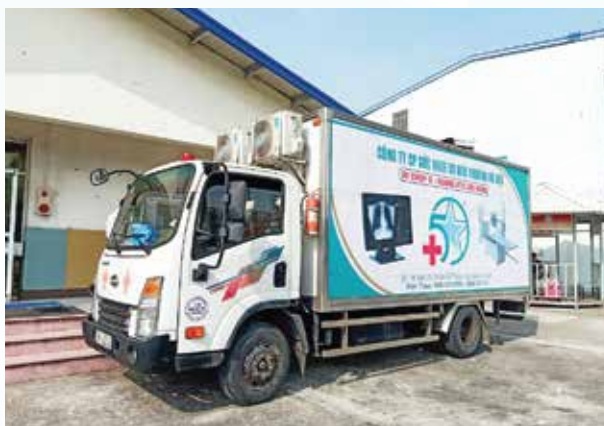
Hệ thống xe X-quang lưu động