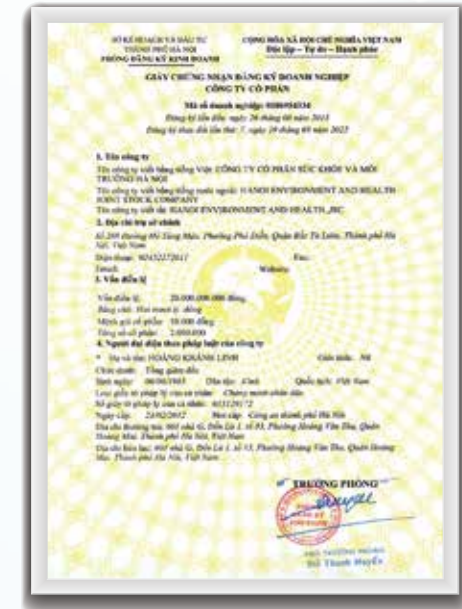
Giấy phép kinh doanh