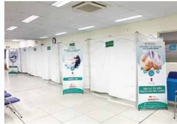
Hệ thống phòng khám lưu động trong nhà