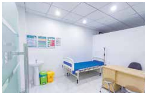
Phòng khám tâm thần