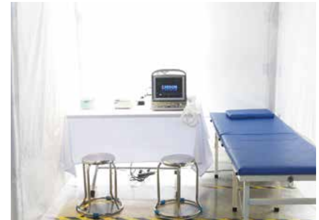
Phòng siêu âm lưu động