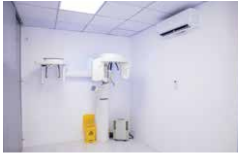
Phòng X-quang răng