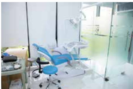
Phòng khám răng-hàm-mặt