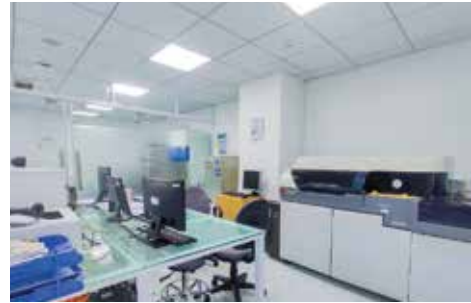
Trung tâm xét nghiệm