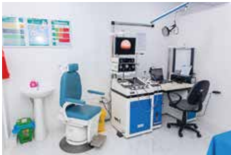
Phòng khám tai-mũi-họng