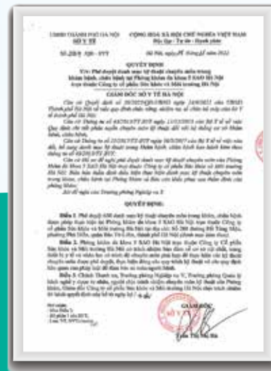
Giấy phê duyệt danh mục kỹ thuật chuyên môn