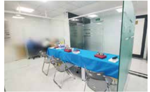
Phòng lấy mẫu