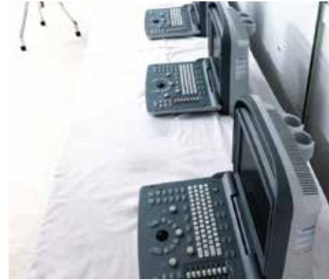
Dàn máy siêu âm lưu động