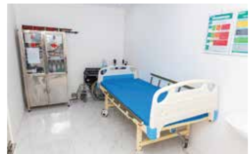
Phòng cấp cứu