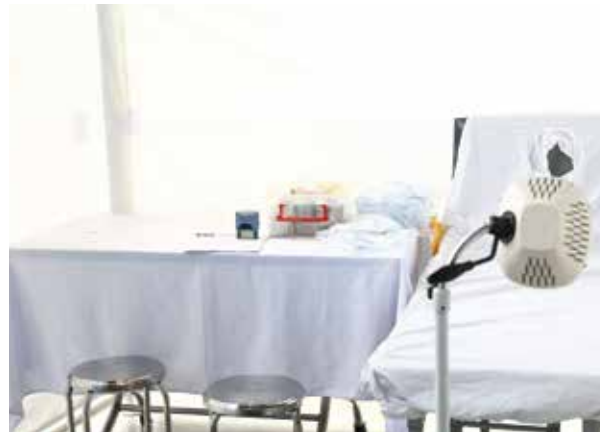
Phòng khám sản - phụ khoa lưu động