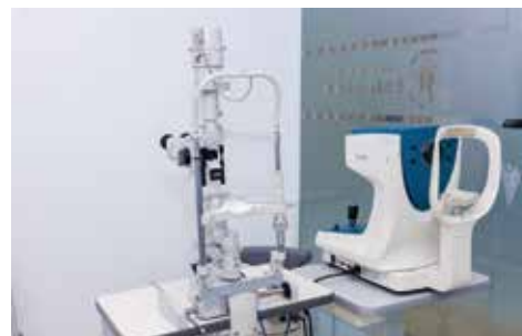
Phòng khám mắt