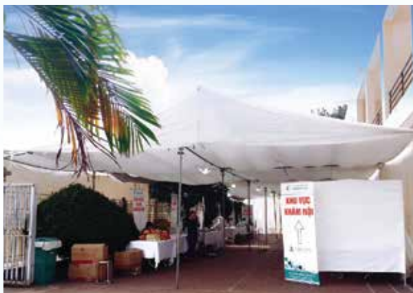
Hệ thống phòng khám lưu động ngoài trời