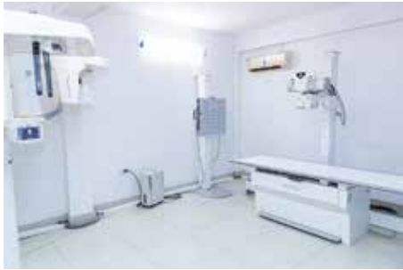
Phòng chụp X-quang